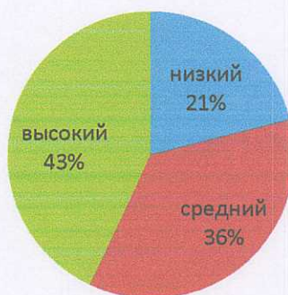
Таблица эффективности работы Сарян Е.П., учителя - логопеда

Благодаря системной работе были достигнуты хорошие результаты.